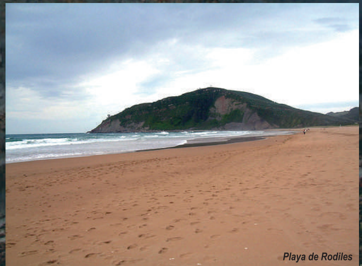
Playa de Rodiles